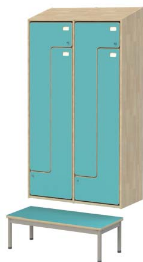
Z400-4 Z-NAULAKKO, 4-ovinen

Runko lakattua massiivikoivua, ovet laminaattia, värit perusvärimallistosta. Ovissa lukko tai nappi. Yhdessä lokerikossa on kaksi osastoa, yhdessä osastossa voi olla 3-4 ovea.