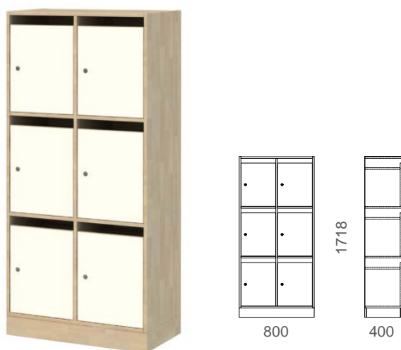
W250-32 LOKERIKKO POSTIAUKOILLA