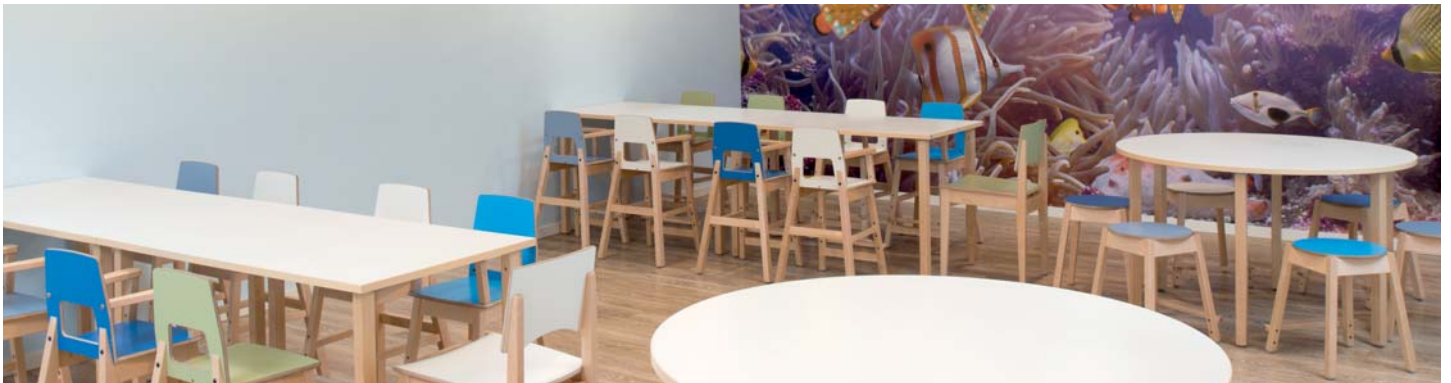
Tischgruppen für Kinder für die Otto-Hochstühle OT450.