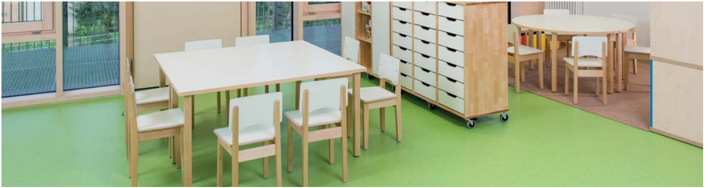
Tischgruppen für Kinder passend zu den niedrigen Onni-Stühlen O300 und O300P für Kinder.