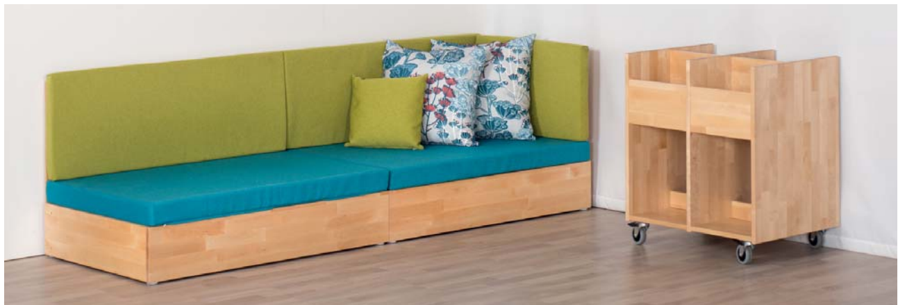
Kahdesta MS100 sohvamoduulista ja yhdestä MS105 selkänojapehmusteesta koostuva kokonaisuus