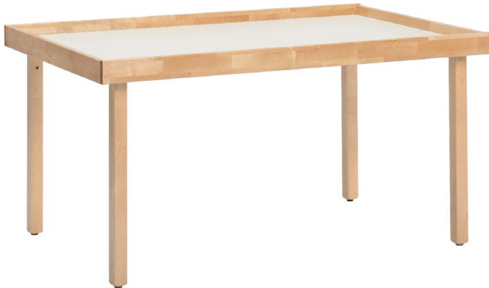
ОТР-1208 Стол для моделирования