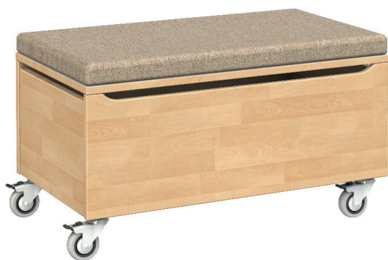
IR10 Sitzhocker, rechteckig