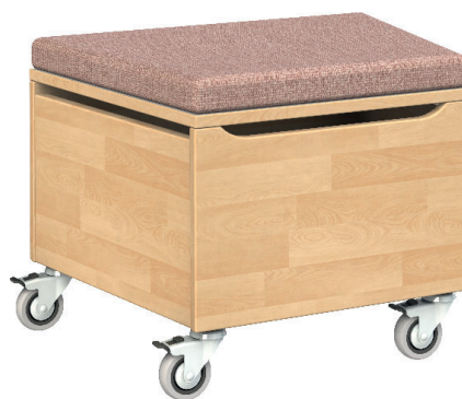
IR15 Sitzhocker, trapezförmig